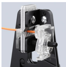
Čistě naříznutí izolace po celém obvodu