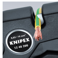
Štípačky na drát do 10 mm 2 vícežilový