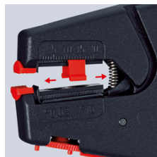
12 40 200: Nastavitelný délkový doraz