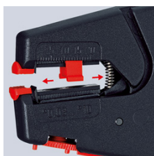
12 40 200: Nastavitelný délkový doraz