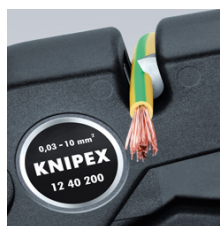
Štípačky na drát do 10 mm 2 vícežilový